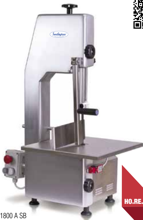
SEG1800 A SB