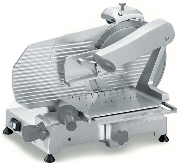
AF300H VS C