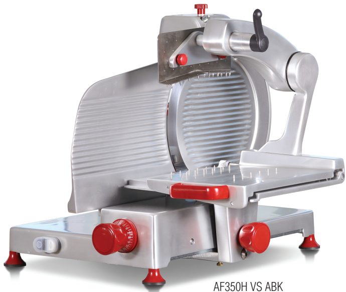
AF350H VS ABK